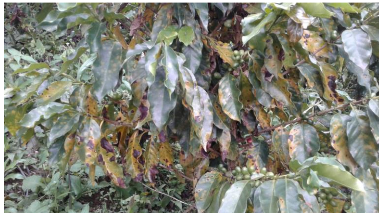
Figura 1. Ataque de roya del cafeto en variedad Costa Rica-95. Vereda los Lobos. Palestina – Caldas. Marzo 2018.

La semana pasada, el Servicio de Extensión de Caldas, en el Municipio de Palestina, sector de la vereda Los Lobos encontró la situación que se describe en las siguientes figuras, correspondientes a marzo de 2018.