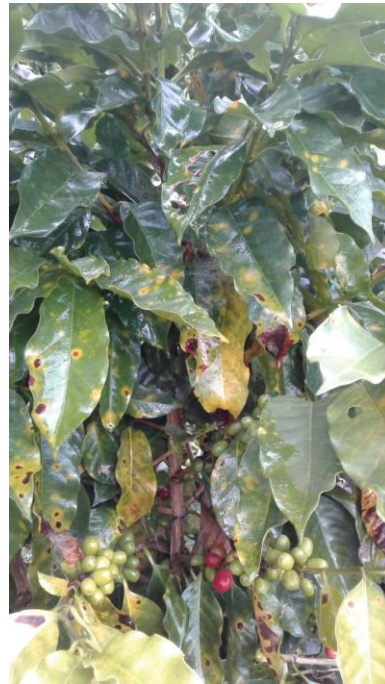
Figura 2. Ataque de roya del cafeto en variedad Costa Rica-95. Nótese las pústulas en las hojas del tercio superior. Palestina, Caldas.