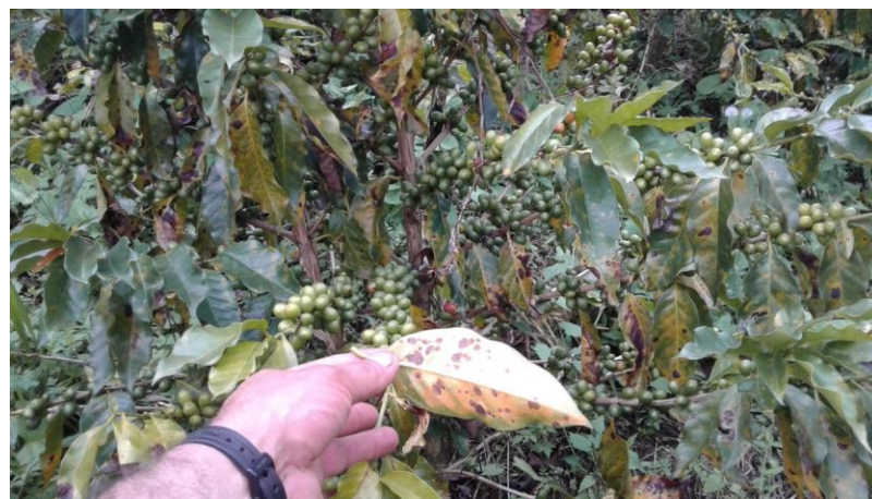
Figura 3. Ataque de roya del cafeto en variedad Costa Rica-95. Nótese el estado de deterioro de la plantación y la alta esporulación del hongo [polvillo amarillo]. Palestina, Caldas.